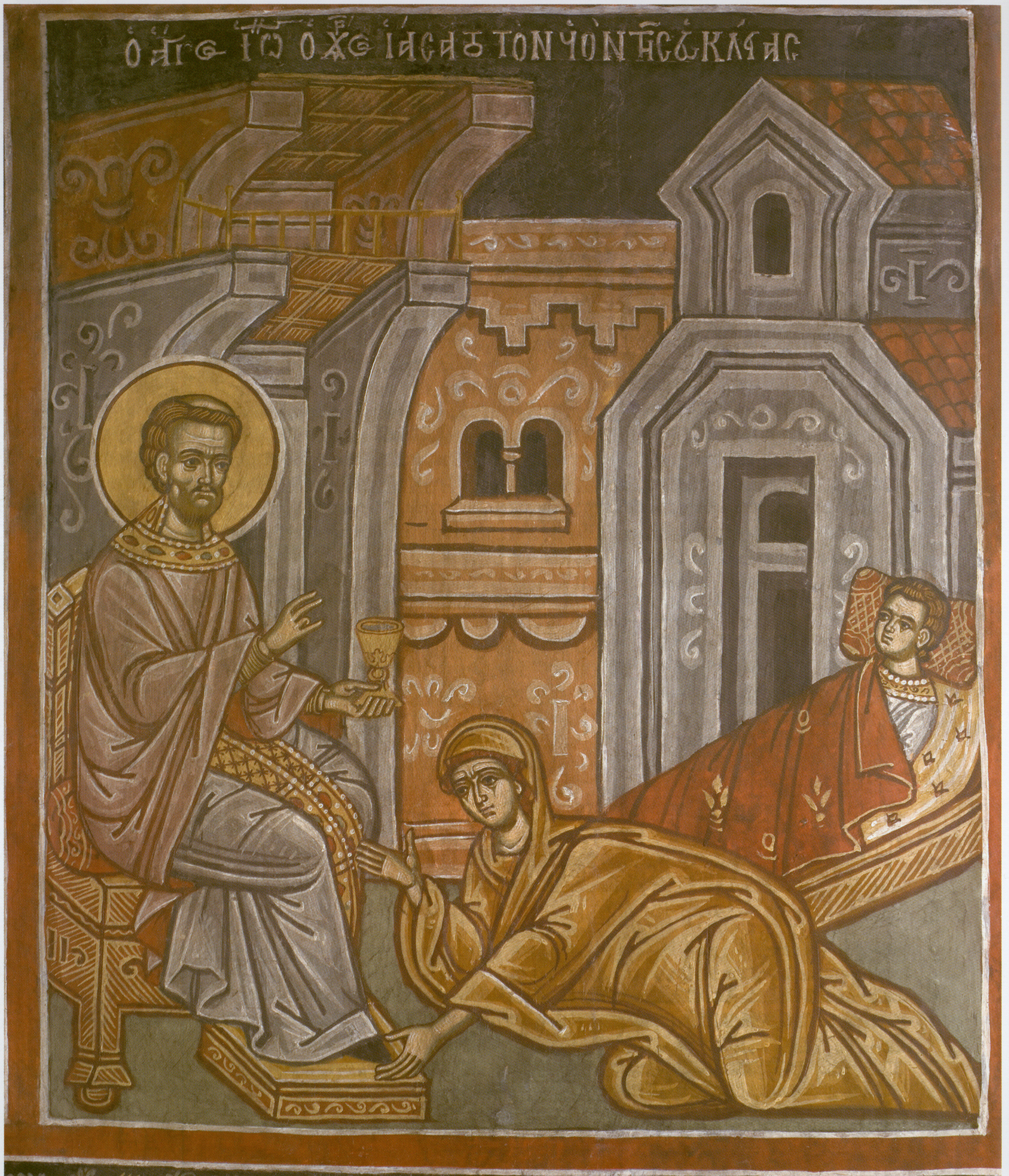
‘Ο ‘Αγ. ‘Ιω. Χρυσόστομος θεραπεύει τόν υιό τής Εύκλείας. Τοιχογραφία από τό φερόννυμο Παρεκκλήσιο τής ‘Ι.Μ. Διονυσίου ‘Αγ. ‘Ορους, 17ος αἰ.