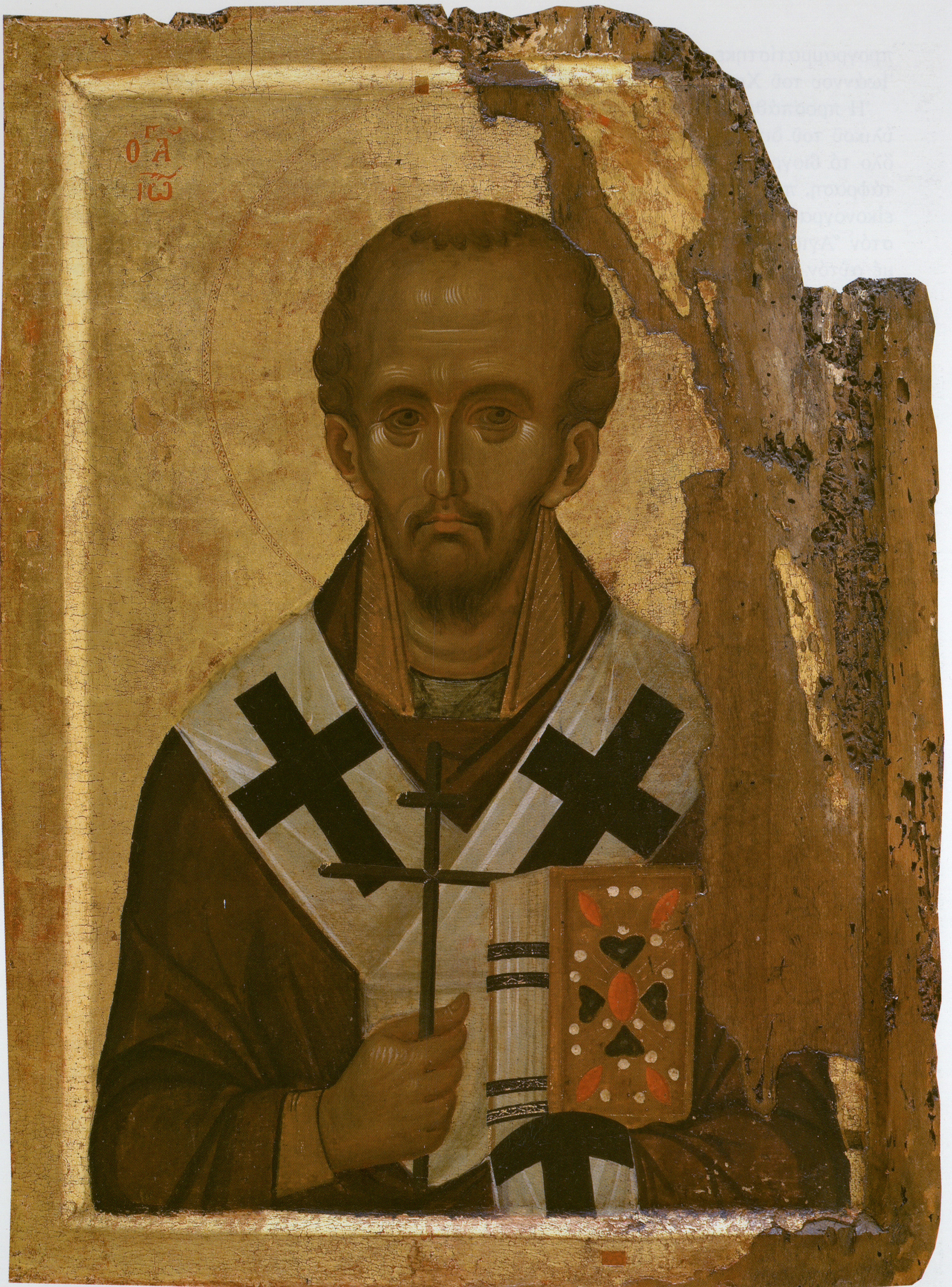
“Αγιος Ἰωάννης ὁ Χρυσόστομος. Φορητή Εἰκόνα, ἀρχές 14ου αἰ., ἀυγοτέμπερα σέ ξύλο. Ἰ.Μ.Μ. Βατοπαιδίου, “Αγ. Ὀρος.