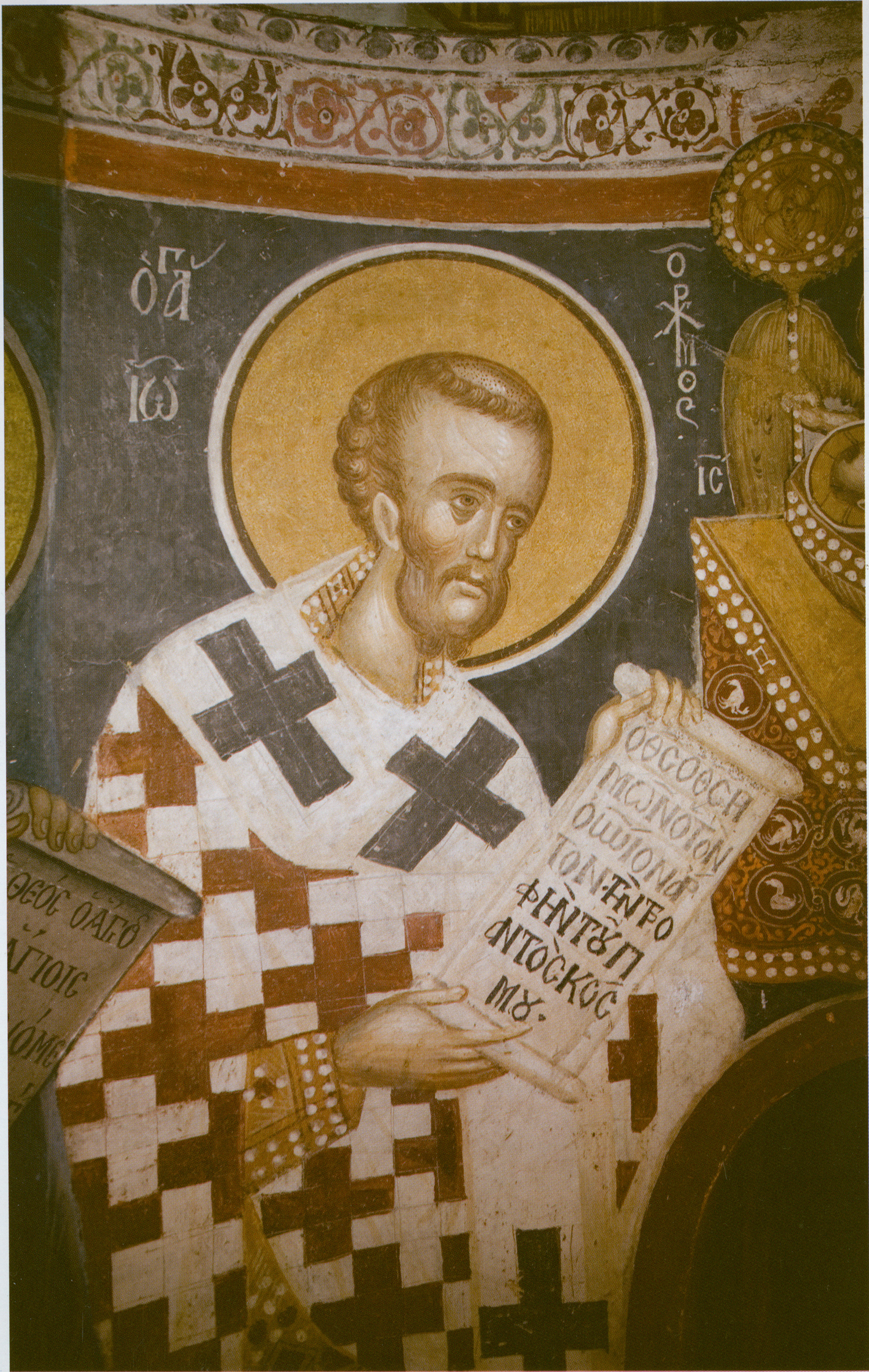
Ἅγιος Ἰωάννης ὁ Χρυσόστομος. Τοιχογραφία Παρεκκλησίου Ἁγίων Ἀναργύρων τῆς Ἱερᾶς Μεγίστης Μονῆς Βατοπαιδίου. Τέλη 14ου αἰ.