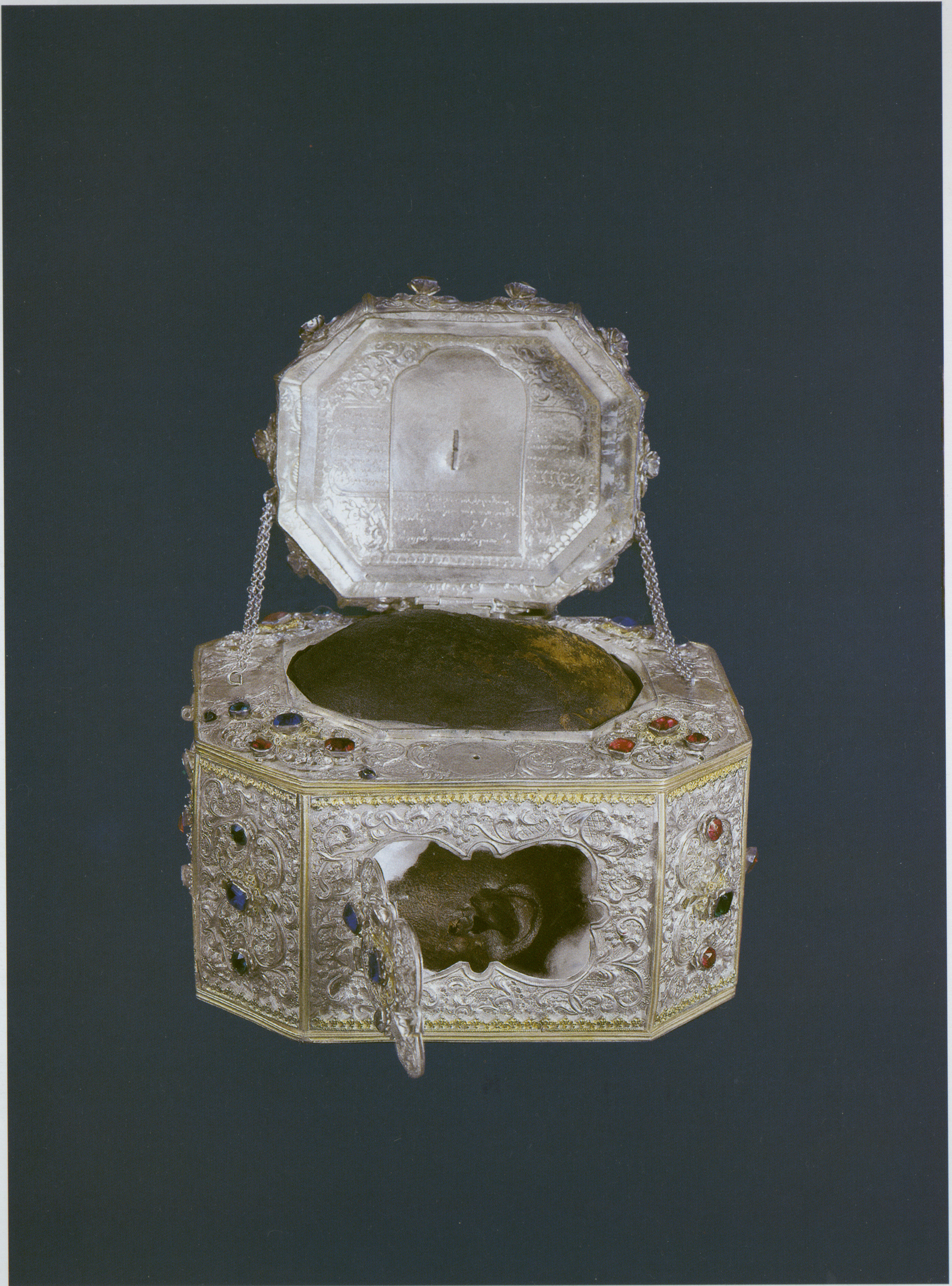
Ἡ τιμία καί μυρίπνοος Κάρα τοῦ Ἁγίου Ἰωάννου τοῦ Χρυσοστόμου μέ τό ἄφθαρτο ἀριστερό αὐτί. Ἱερά Μεγίστη Μονή Βατοπαιδίου Ἁγίου Ὄρους.