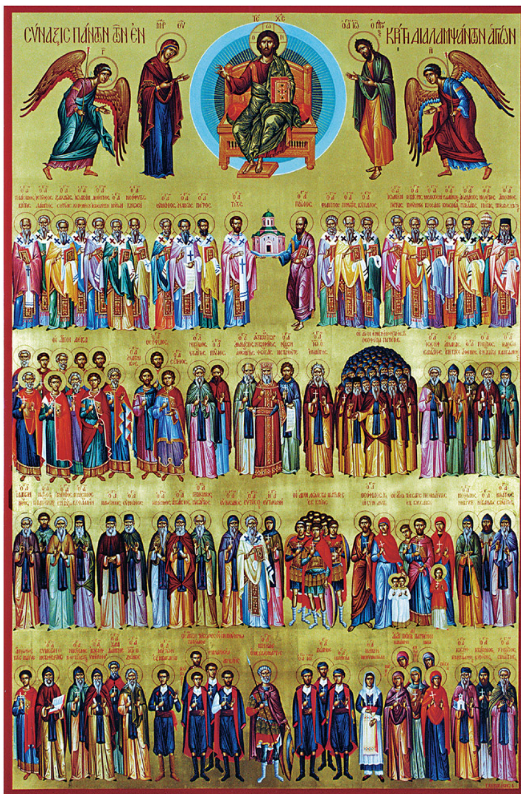
Ἡ Σύναξις Πάντων τῶν ἐν Κρήτῃ διαλαμπάντων Ἀγίων. Φορητὴ Εἰκόνα Ἱ. Μητροπολιτικοῦ Ναοῦ Μεγάλῃς Παναγίας Νεαπόλεως Κρήτης. Χεὶρ Γεωργίου Χειρακάκη, 2000.