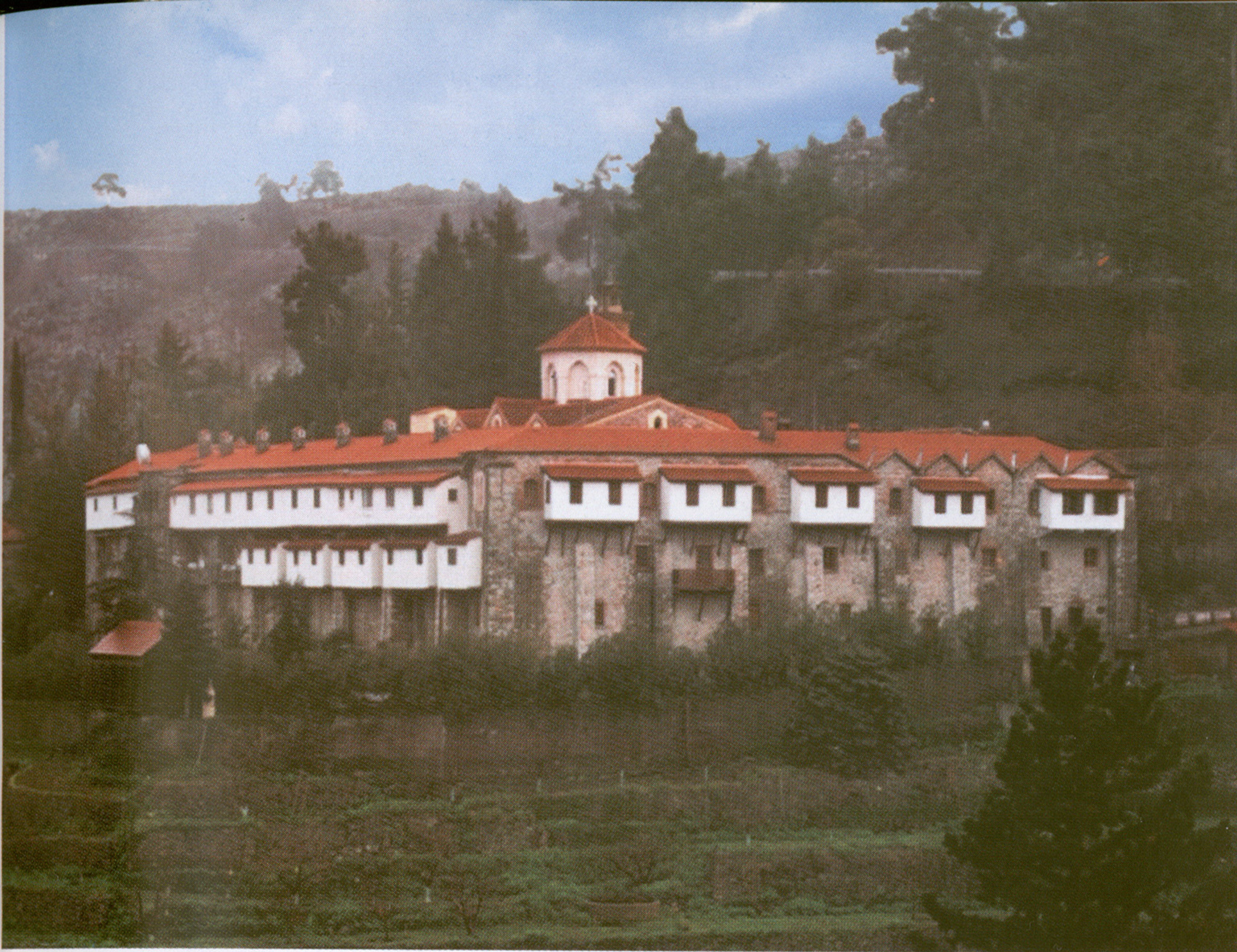
Ἱερά Μονή Μαχαιρᾶ (ἄνω), Ἱερά Μονή Ἁγίου Ἡρακλειδίου (κάτω)