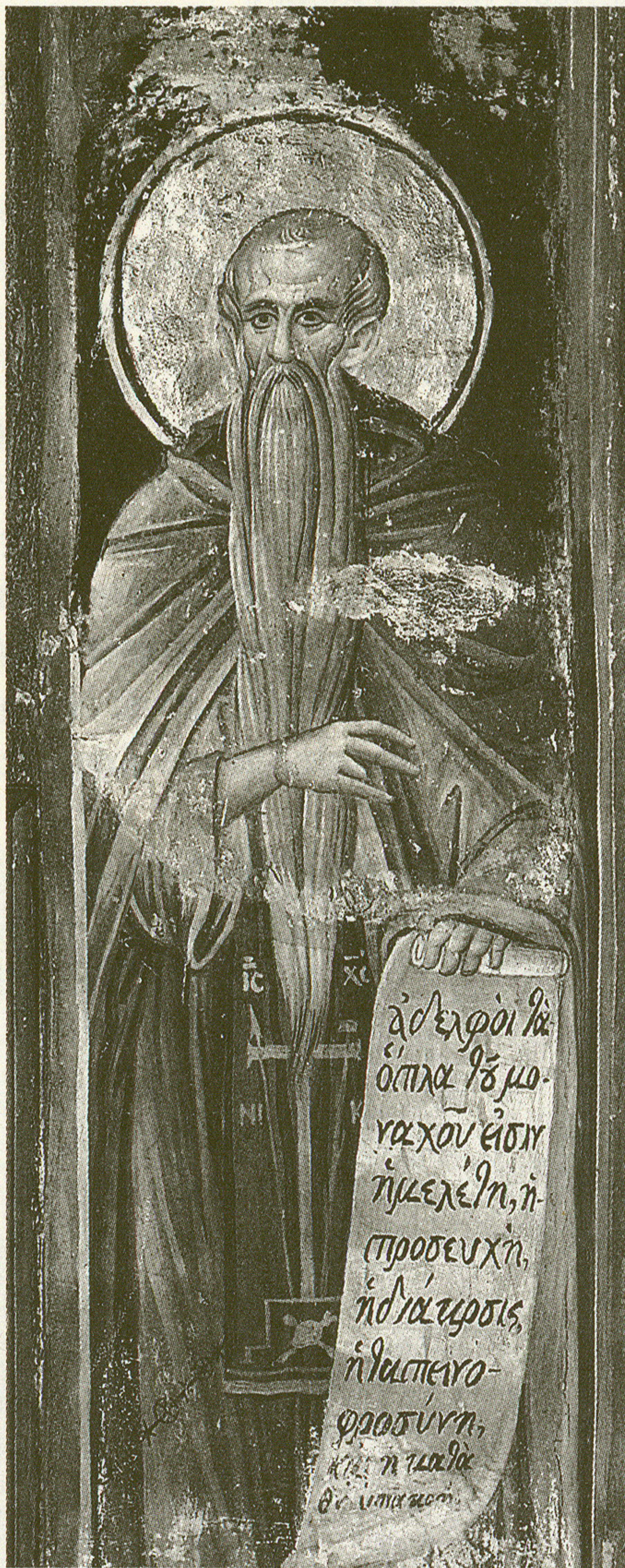
Ὁ ὁσιος Εὐθύμιος ὁ Μέγας