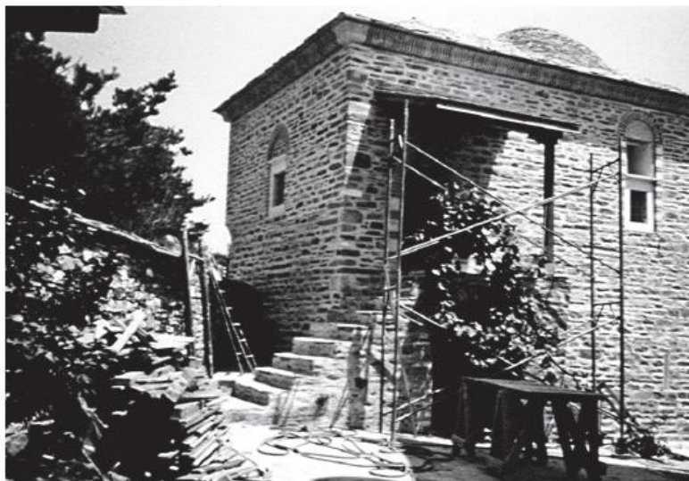
Είκ. 26. Άποψη από τα νοτιοδυτικά μετά τὸ πέρασ τῶν ἐργασιῶν.