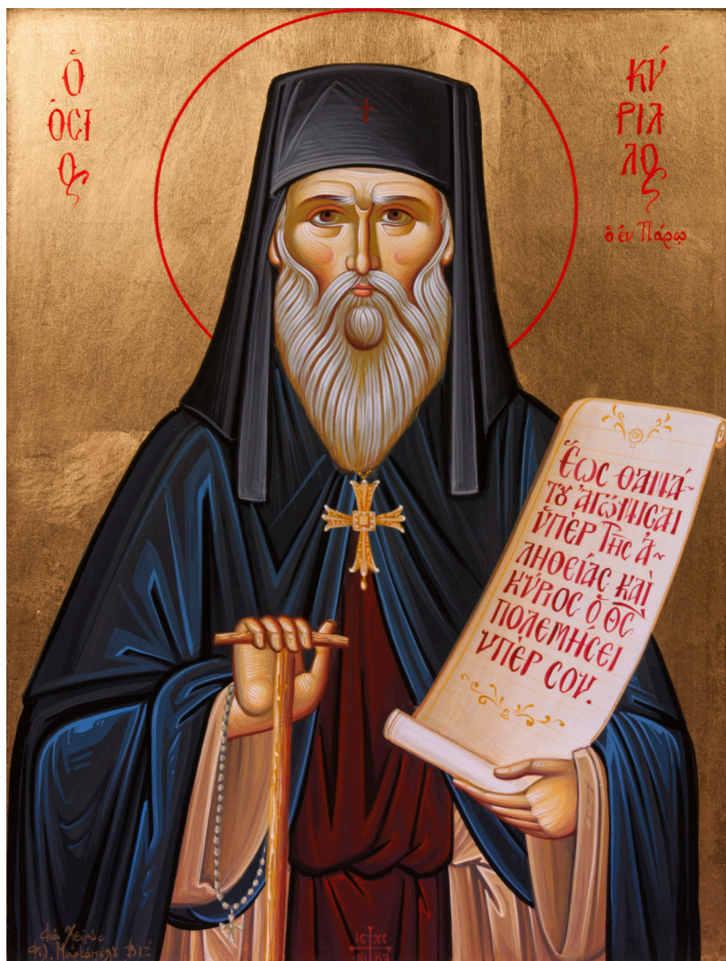
Εἰκόνα τοῦ ἀγιογράφου Φώτη Μαρκόπουλου, 2017. Ἀφιέρωμα Κωνσταντίνου Κανέλλου στὴν Ἱ. Μονὴ Ἁγίου Ἀντωνίου Μαρπήσσης Πάρου.