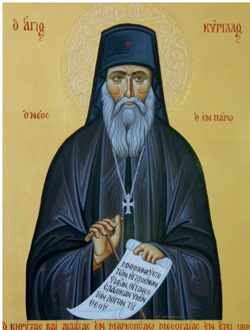
1. Εἰκόνα τοῦ Ὁσίου Κυρίλλου στὸν Ἱερὸ Ναὸ Ἁγίας Παρασκευῆς Μαρκοπούλου Ἀττικῆς