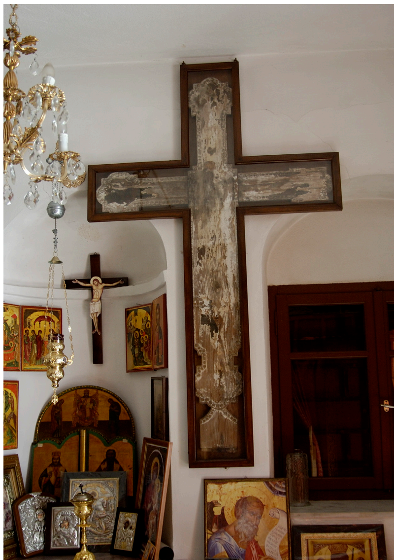
3. Ὁ Σταυρὸς τοῦ Ὁσίου Κυρίλλου ποὺ φυλλάσσεται στὴν Ἱ. Μονὴ Χριστοῦ Δάσους – Ἁγίου Ἀρσενίου Πάρου. Σημείωμα ἐπὶ τοῦ Σταυροῦ: «Ὁ σταυρὸς οὗτος εἶναι ὁ φερόμενος ἐπὶ τοὺς ὤμους τοῦ ἁγίου Πατρὸς Κυρίλλου καὶ ἰδρυτοῦ τῆς Ἱερᾶς Μονῆς ταύτης, τὴν ἐποχὴν καθ' ἣν ἡ νόσος πανώλης ἐλυμαίνετο τὴν νῆσον Πάρον κατὰ τὸ ἔτος 1820».